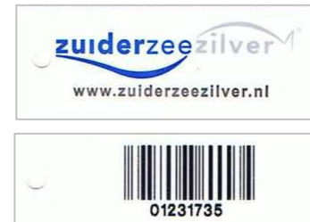
Label voor- en achterkant

Zuiderzeezilver geeft labels met unieke barcodes uit aan beroepsvissers en vis(groot)handelaren. Zij bevestigen de labels aan individuele of partijen vis en/of registreren de gegevens (zoals vissoort en klant) op www.twaka.nl/zuiderzeezilver . Deze website is gekoppeld aan www.zuiderzeezilver.nl , waarop ketenpartners en consumenten de vis online kunnen volgen.